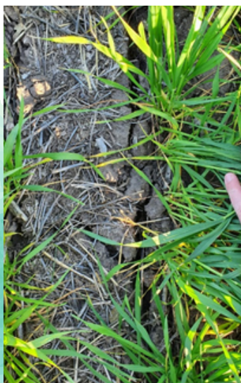
Oro Verde, 21 de agosto 2020.

Los cultivos de trigo en Entre Ríos se encuentran en general en los estadios fenológicos Z2.5 a Z3.2. Algunos lotes están superando Z3.7