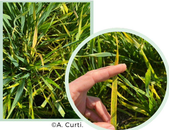
Herrera, Uruguay. 20 de agosto 2020.