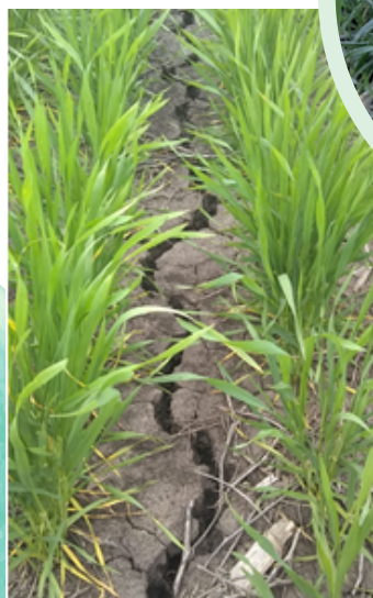
Santa Anita, Uruguay, 25 de agosto 2020.