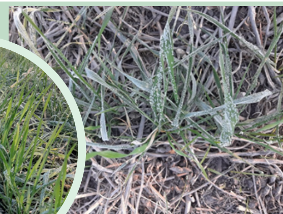
Oro Verde, 21 de agosto 2020.

Lotes con buena implantación presentan un estado general bueno; la mayoría transitando una etapa difícil de estrés hídrico y heladas de gran magnitud (hasta -8^{\circ}\text{C} ).