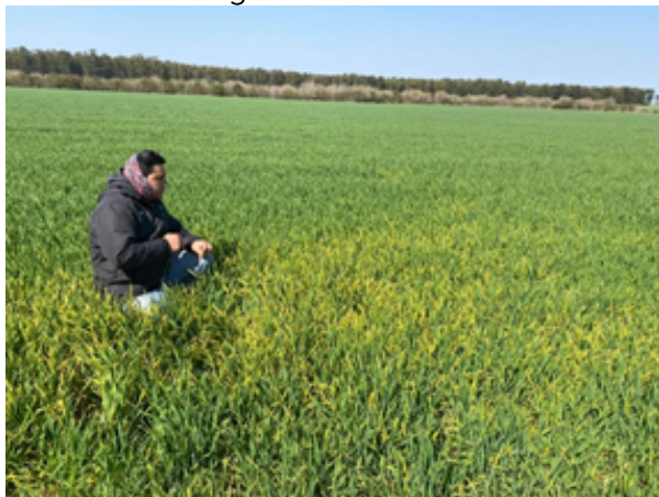
Herrera, Uruguay. 20 de agosto 2020.