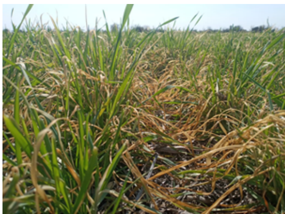
Santa Anita, Uruguay.